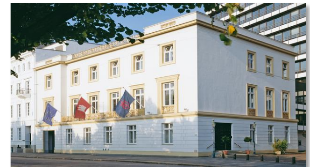
Der Übersee – Club e.V. Hamburg