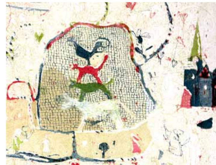
Falko Behrendt: „Jubiläumskonzert“, Farbradiierung (Ausschnitt)